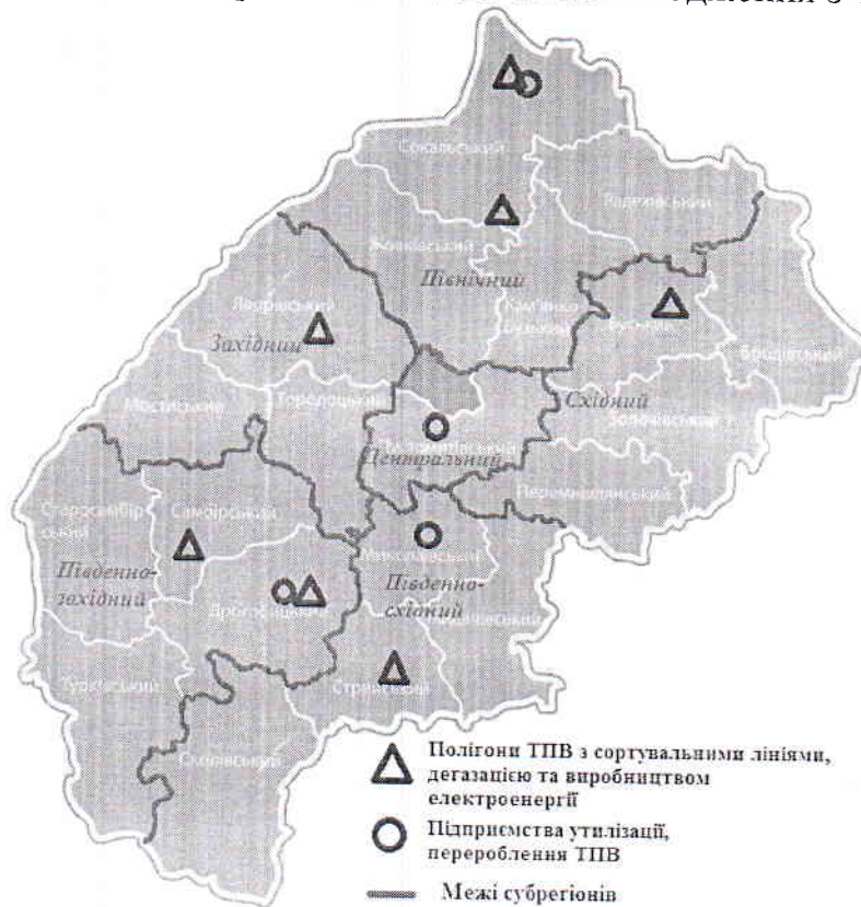
Рис. 4. Розташування об'єктів захоронення ТПВ

Схематичне розміщення об'єктів поводження з ТПВ наведено на рис. 4.