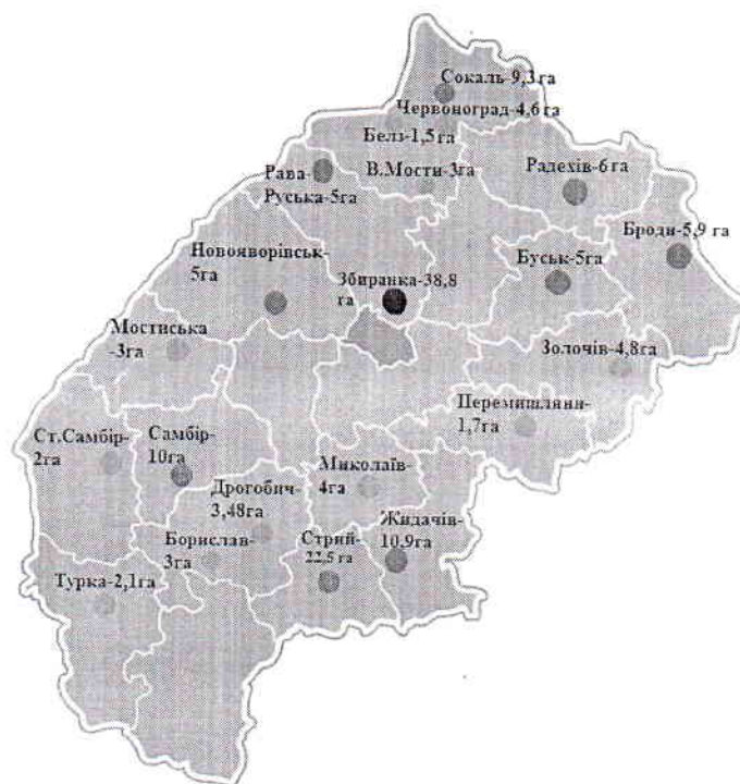
Рис. 1. Розташування об'єктів захоронення ТПВ на території Львівської області

Розташування об'єктів захоронення ТПВ на території Львівської області (рис.1).