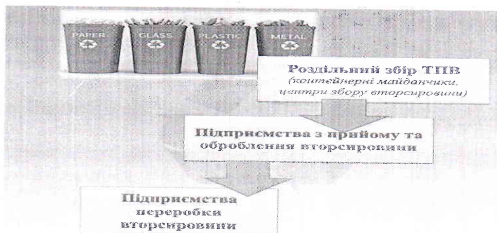
Рис.3. Роздільний збір ТПВ

Після роздільного збору ТПВ, відсортовані відходи надходять на сортувальні підприємства, а звідти на переробні підприємства (рис. 3).