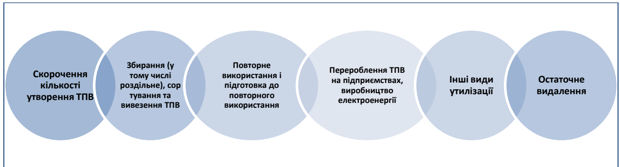
Рис. 3. Управлінські підходи в системі управління ТПВ

Запровадження комплексної системи управління ТПВ для реалізації Стратегії передбачає послідовність управлінських підходів (рис. 3). План-графік виконання заходів Стратегії наведено в додатку 1.