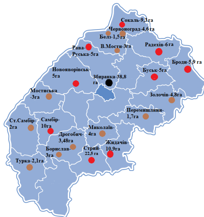
Рис. 1. Розташування об'єктів захоронення ТПВ на території Львівської області

Розташування об'єктів захоронення ТПВ на території Львівської області (рис.1).