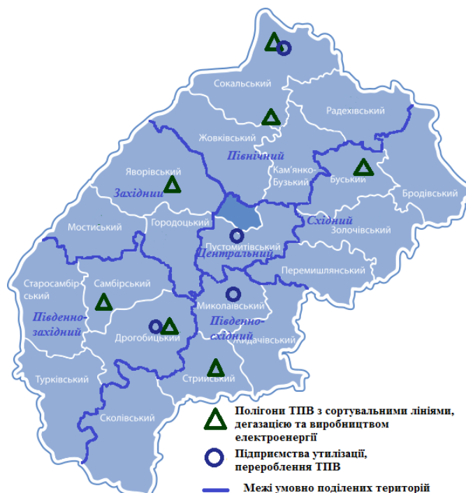
Рис. 5. Розташування об'єктів захоронення ТПВ

Схематичне розміщення об'єктів управління ТПВ показано на рис. 5.