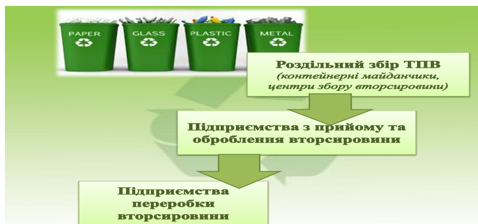
Рис.4. Роздільний збір ТПВ

Після роздільного збору ТПВ, відсортовані відходи надходять на сортувальні підприємства, а звідти на переробні підприємства (рис. 4).